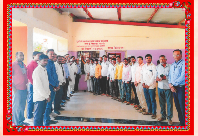
संस्थेचे वतीने कुंभार पिंपळगांव येथील बस स्थानकात येणाऱ्या प्रवाशांना थंड व शुद्ध पिण्याचे पाणी मिळावे यासाठी वॉटर फिल्टर देण्यात आले. त्यावेळी उपस्थित संचालक मंडळ व प्रवाशी व मान्यवर.