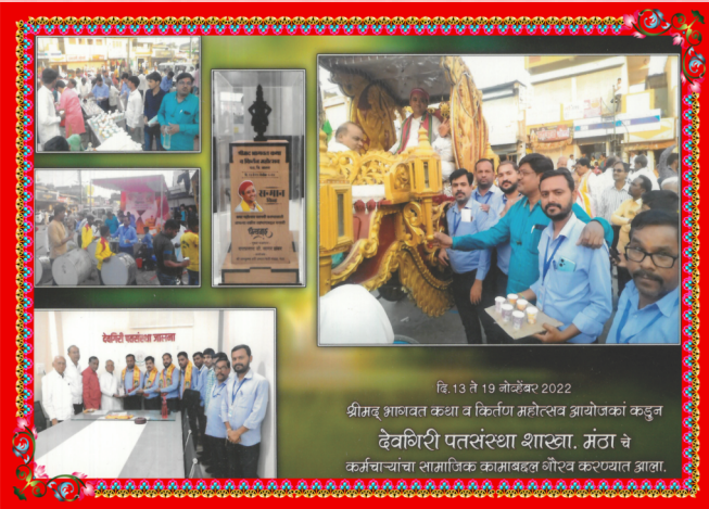
श्रीमद् भागवत कथा व किर्तन महोत्सव आयोजकांकडून देवगिरी पतसंस्था शाखा, मंठा चे कर्मचाऱ्यांचा सामाजिक कामाबद्दल गौरव करण्यात आला.