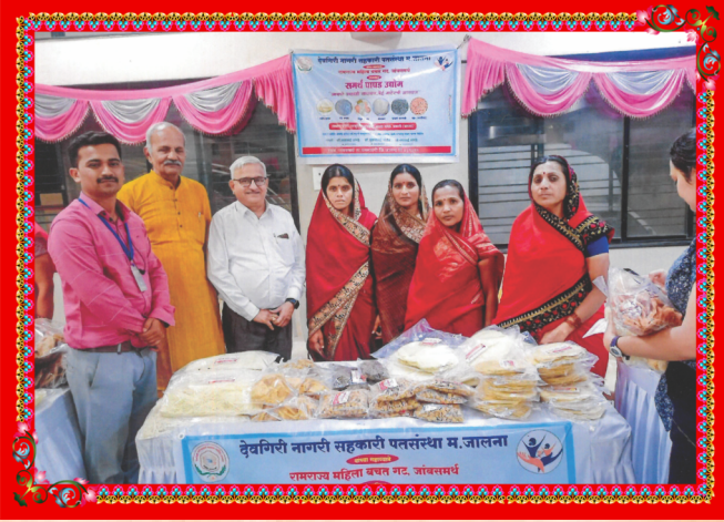
नाशिक येथे झालेल्या पापड महोत्सवात कुंभार पिंपळगांवच्या बचत गटास प्रथम पारितोषिक मिळाले.